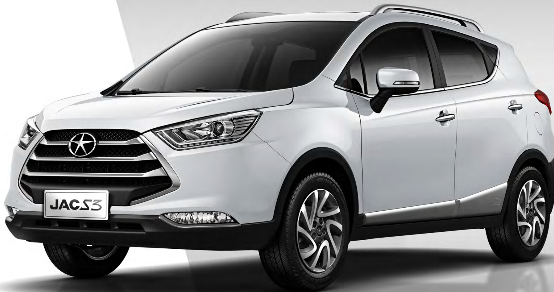
Imagen de referencia, algunas características técnicas y accesorios pueden cambiar sin previo aviso www.jacmotors.com.co